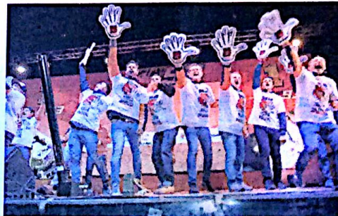
La fiesta final, con todo el equipo ante miles de paisanos.