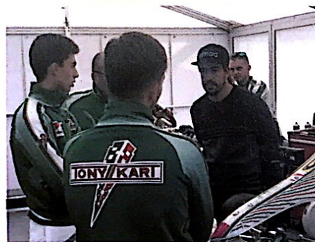
Buena relación con Fernando Alonso

Esto es algo del equipo, Tony Kart, que tiene un acuerdo técnico con la Ferrari Driver Academy. De vez en cuando organizan 'campus' y actividades para algunos pilotos de Tony Kart y vamos a entrenar con los pilotos de la FDA. A mí me llamaron dos veces para probar el Fórmula 4 en Fiorano y fueron dos experiencias buenisimas. Estando en el mítico circuito de Fiorano, donde probaron Schumacher, Vettel, Alonso... cuando estás en Maranello, es